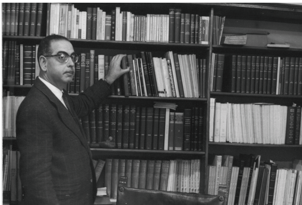
Foto 2. Museo de Oviedo, hacia 1960.