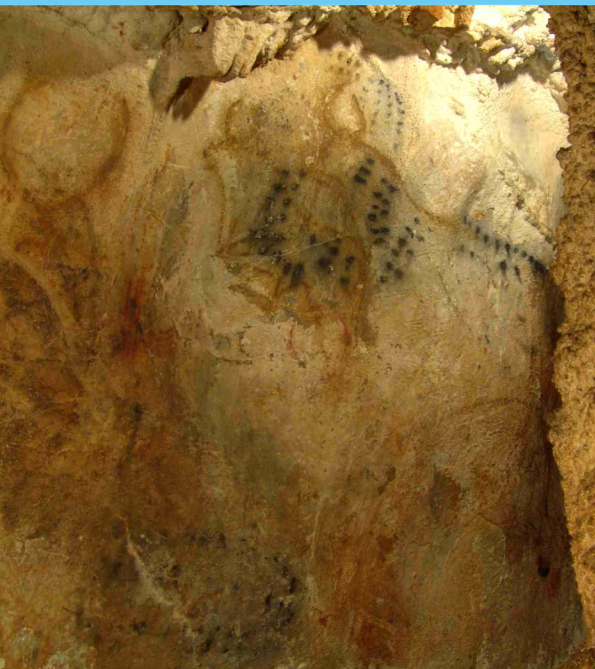
▲ Muro de los Grabados. Uros